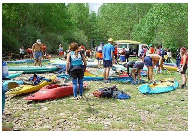
Imágenes de la salida en el “Torcón

El plazo de inscripción se abre El día 10 de mayo hasta el 24 de mayo en la web deportes.diputaciondeburgos.es ,