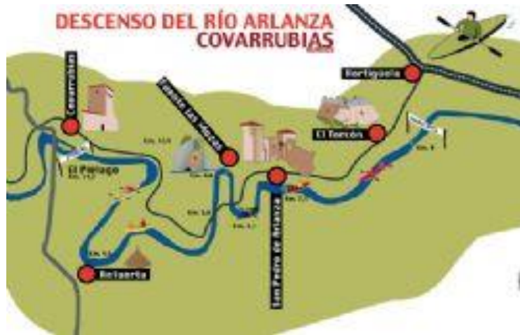
Recorrido del Descenso del Arlanza

Aquella tradición paso a mejor vida cuando los miembros de la Hermandad dejaron la organización en manos del Centro de Inicialivas Turísticas de Covarrubias. A partir de ese momento se trataba de recuperar el tesoro de Fernán González, oculto entre los recovecos del río, y que los palistas tenían que localizar ayudados por un plano. Al aumentar el número de participantes, se hizo más difícil mantener estas actividades, convirtiéndose el descenso en la Fiesta que es hoy.